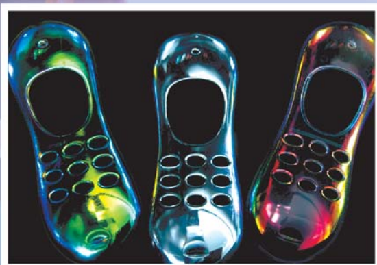
In-moulding en carcasas de móviles

Etiquetado, envases y embalajes, expositores, Carteleria, plv's, decoración, construcción, etc.