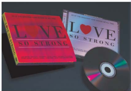
Embalaje de CD's

Los materiales Radiant están disponibles en versión opaca y transparente (para laminar sobre superficies ya impresas). Ambas versiones se pueden imprimir y se presentan con o sin adhesivo. La aplicación de estos materiales sobre superficies de color modifica la gama de colores básicos del Radiant, aportando una mayor vistosidad y exclusividad al producto final.