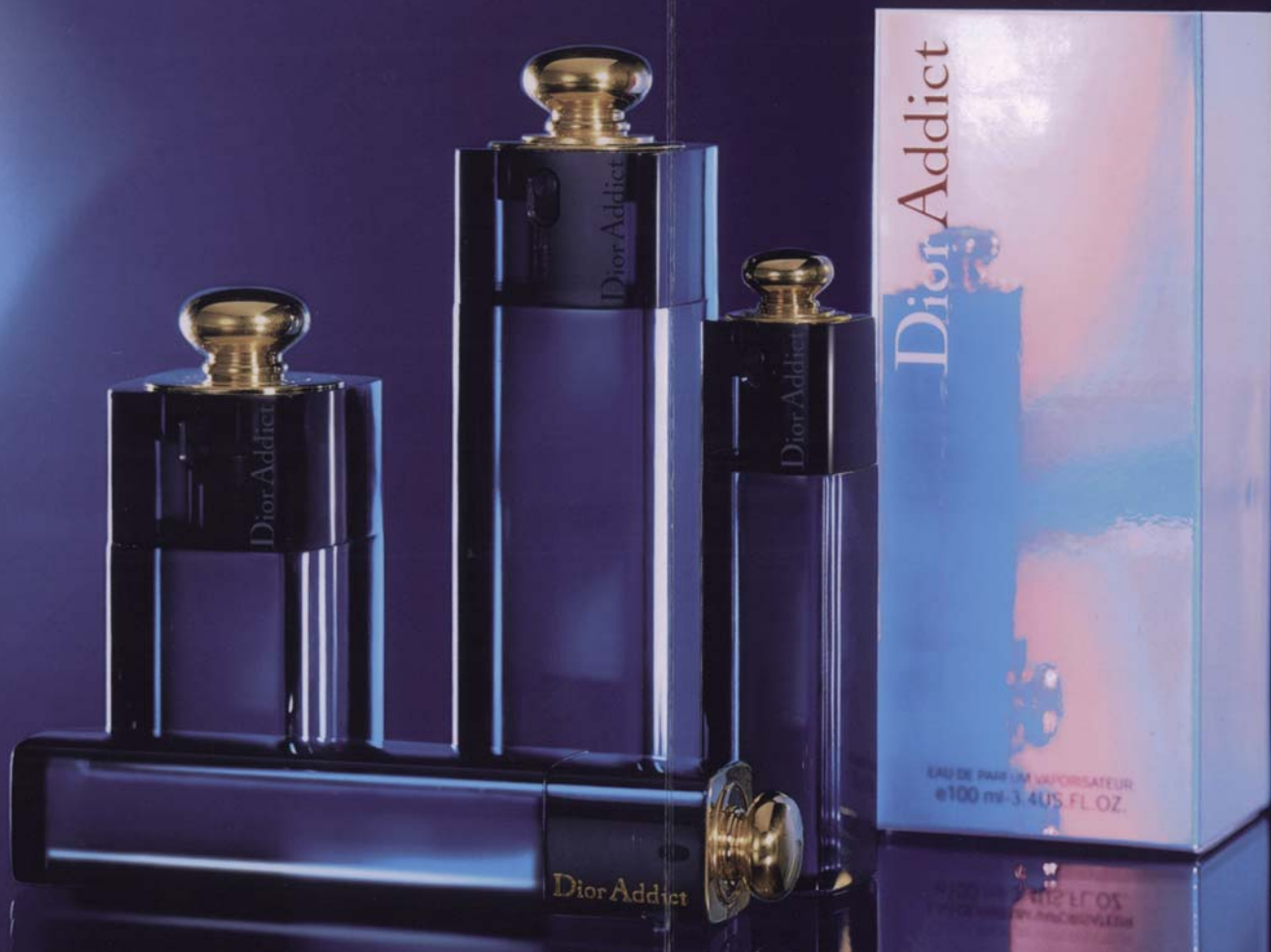
Embalajes cosmética y perfumes.