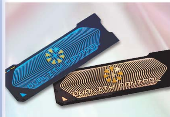
Etiquetas de seguridad