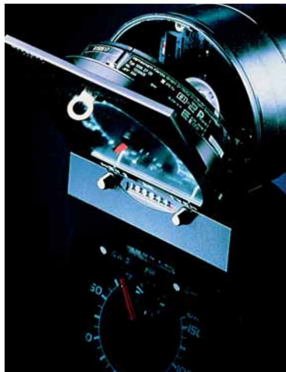
Etiquetado de instrumentación