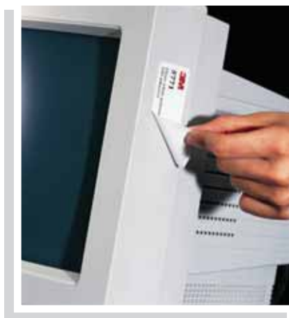
Aplicación sobre carcasa de ordenador

Etiquetas para código de barras, etiquetas de advertencia o con instrucciones y en general cualquier etiqueta que necesite ser retirada después de un tiempo de utilización sin dejar residuos de adhesivo.